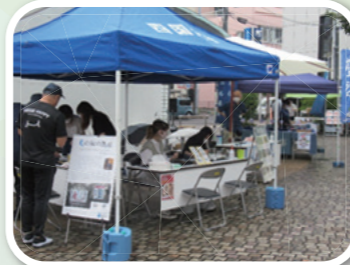
▲とくしまマルシェ(6月) 沈殿藍を使った揮毫