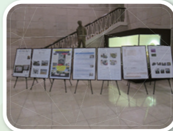
▲徳島県議会棟ロビーでの展示 研究成果紹介パネル