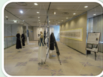
▲阿波おどり会館での展示 藍染ドレス、藍絵巻パネル、藍墨の書