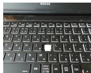
(キーボード不具合)