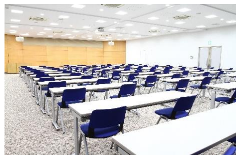
5F フォーラムホール