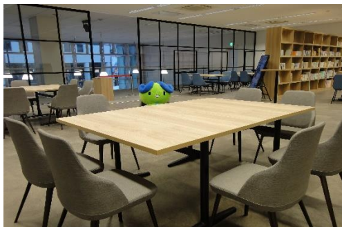
2F ステイ・ コミュニケーション スペース