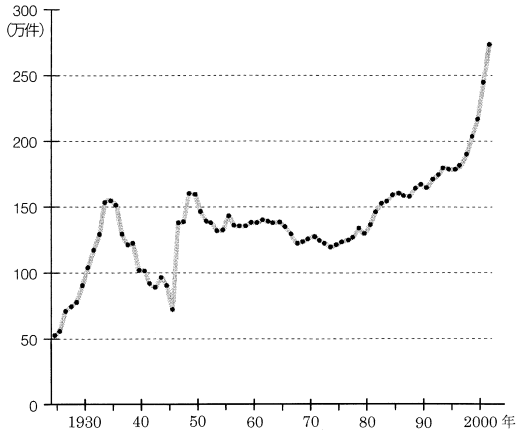
図1 刑法犯認知件数の推移