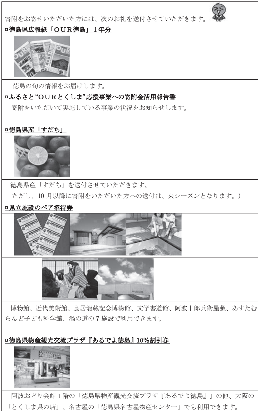
表6 徳島県ふるさと納税の特典

(出典) 徳島県「ふるさと“OURとくしま”応援サイト」。 http://www.pref.tokushima.jp/docs/2010122700090/ (最終閲覧日2014年12月18日)