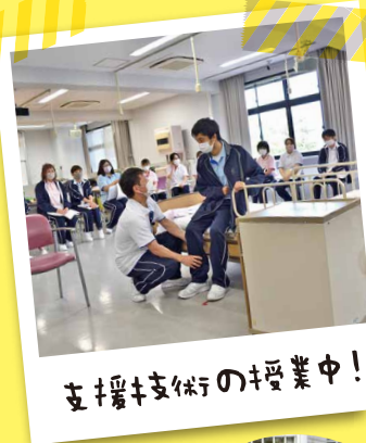
支援技術の授業中!