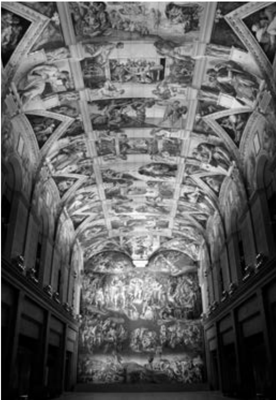
大塚国際美術館

大塚グループは、グローバルな企業になりましたが、「徳島回帰」つまり「発祥の地、徳島を大切にして地元 の発展とともに成長していきたい」と考えています。2020年9月には、大塚製薬の国内6番目の医療用医薬品工場として「徳島美