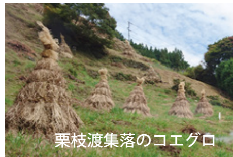
栗枝渡集落のコエグロ