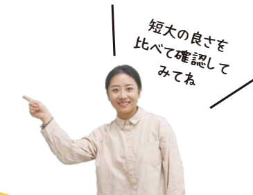
短大と、4大、専門の特徴