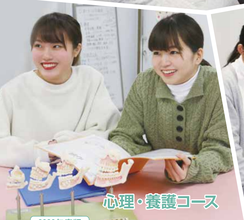
心理・養護コース