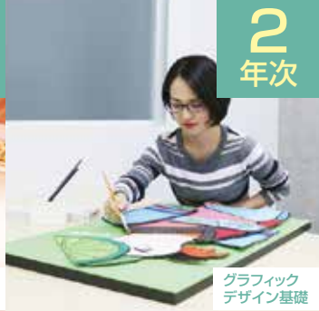
グラフィック デザイン基礎