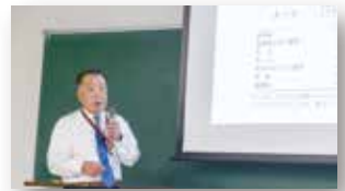
専門性の高い講義内容

公認心理師は、心理に関する支援を要する方々に対する心理状態の観察や相談及び助言など4種類の業務が定められています。その活動は、保健医療、福祉、教育、司法・犯罪、産業・労働など幅広い分野に及びます。