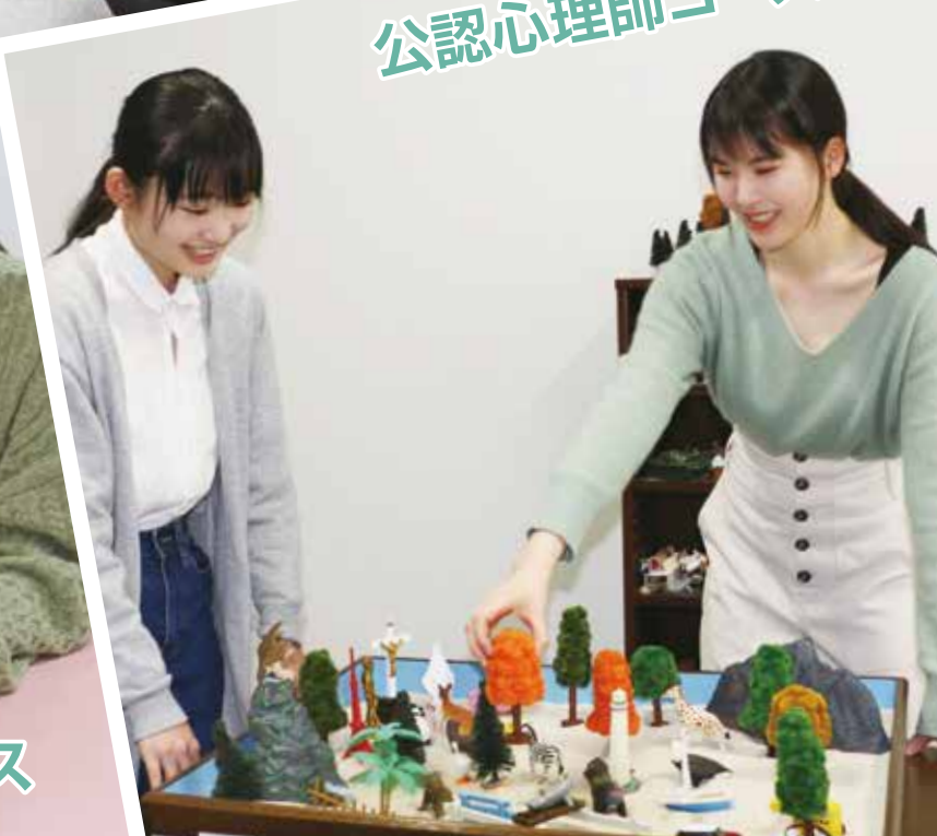
公認心理師コース