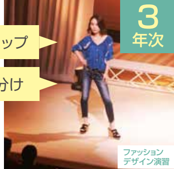
ファッション デザイン演習