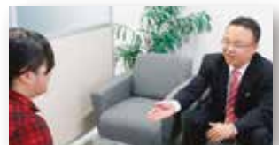
業務の基本となる面接演習