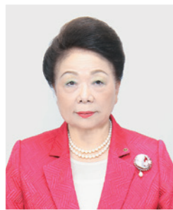
徳島県商工会議所連合会会長 徳島商工会議所会頭